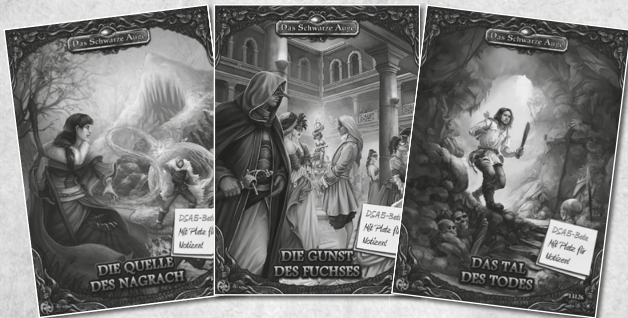
Die Quelle des Nagrach Artikelnr. 13124

Mit den spielfertigen Beta-Abenteuern könnt ihr eure Helden auf Abenteuer ausschicken. Macht euch im hohen Norden des Bornlands auf, uralte Mysterien und Die Quelle des Nagrach zu erkunden. Erwehrt euch Intrigen in den Palästen der Reichen und Mächtigen und sichert euch Die Gunst des Fuchses , oder wagt euch durch die undurchdringlichen Dschungel Meridianas bis in Das Tal des Todes vor.