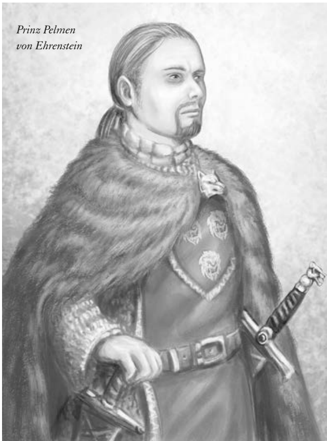
Prinz Pelman von Ehrenstein

Folgen die Helden Royan, führt er sie zum Haus Drachenstein , dem besten Hotel in Vallusa (#10 auf dem Stadtplan). In einem gemütlichen Gasträum hält ein beeindruckender Mann Hof. Prinz Pelman wirkt ernst und unterhält sich gerade mit zwei Frauen, einer Magierin des Ordens der Grauen Stäbe und einer hesindegeweihten Draconiterin. Als die Helden eintreten, unterbricht er sein Gespräch und winkt sie heran.